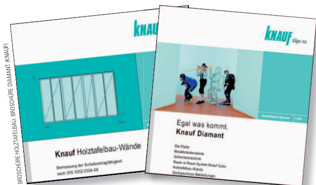
Bild 5: Planungshilfe für den Zimmerer: In den Broschüren Holztafelbau und Diamant der Knauf AG sind z.B. die Feuerwiderstandsklassen und Schalldämm-Maße der Wände sowie Konstruktionsdetails sind enthalten

sowie eine größere Oberflächenhärte und Stoßfestigkeit aufweisen. Diese Platten sind gleichzeitig imprägniert und als Feuerschutzplatten anwendbar (Typ GKF i ). Ein Vergleich „herkömmlicher“ Gipskartonplatten mit einer speziellen „Statikplatte“ stellt Tabelle 3 dar.